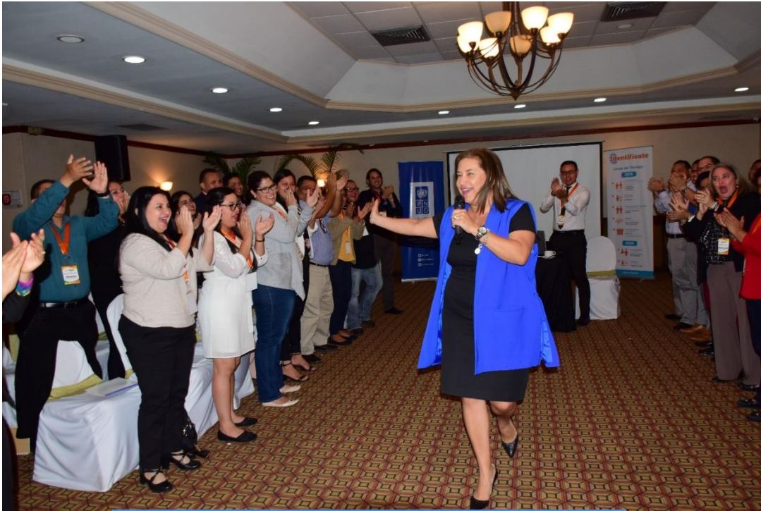
CIERRE DE LA FASE I CAPACITANDO CAPACITADORES, TEMA PSICOLOGIA POSITIVA HOTEL HONDURAS MAYA, 25 de octubre 2019