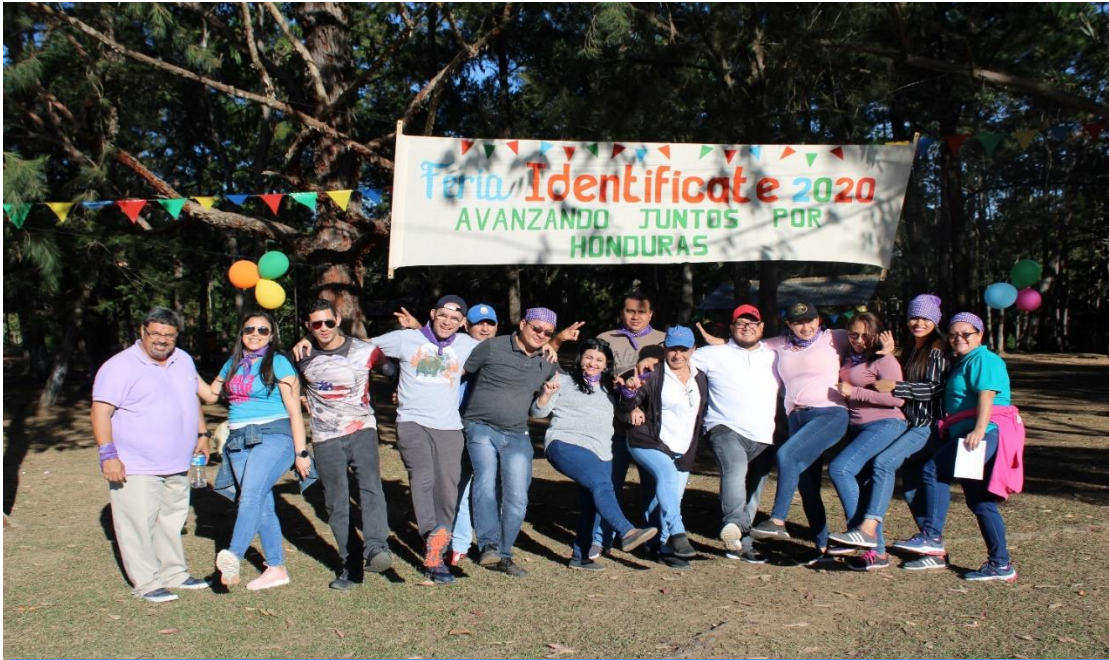
FERIA IDENTIFÍCATE ACTIVIDADES DE FORTALECIMIENTO DE LAS UNIDADES Y EQUIPOS DE TRABAJO DEL “PROYECTO IDENTIFÍCATE” VALLE DE ÁNGELES, 3 de enero 2020