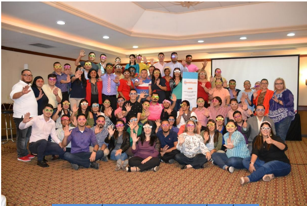
CAPACITACIÓN EN EL TEMA DE INCLUSIÓN Y GÉNERO JORNADA CAPACITANDO CAPACITADORES HOTEL HONDURAS MAYA, 10 de octubre 2019