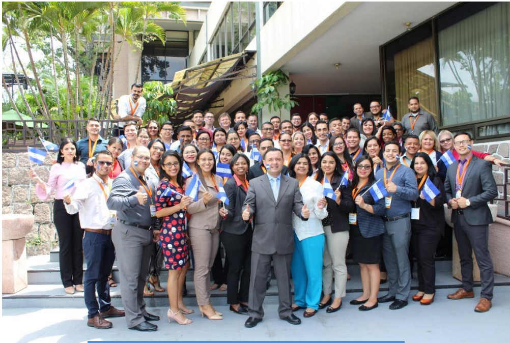
JORNADA DE CAPACITANDO CAPACITADORES, FORMANDO PERSONAL ALTAMENTE EXITOSO HOTEL HONDURAS MAYA, 16 de octubre 2019