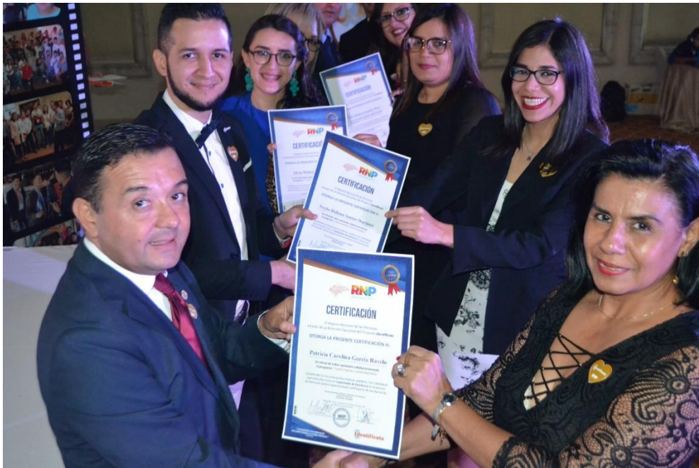
GRADUACIÓN DE LA I FASE CAPACITANDO CAPACITADORES HOTEL PLAZA DEL GENERAL, 06 de noviembre 2019