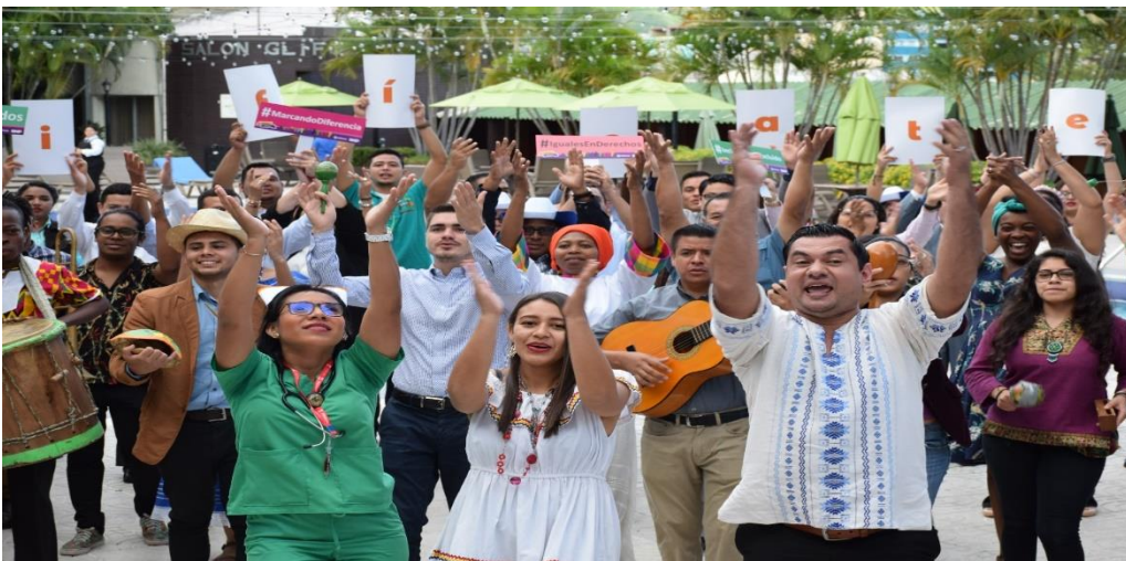
GRABACIÓN DEL VIDEO “MAREA DE GENTE” POR LOS CAPACITADORES DEL PROYECTO IDENTIFICTE HOTEL HONDURAS MAYA, 24 de octubre 2019