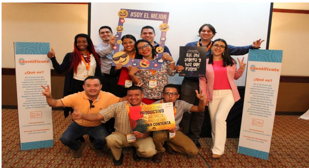
FORMANDO PERSONAL DE CAPACITACIÓN EN EL TEMA PASION POR LO QUE HACES HOTEL HONDURAS MAYA, 04 de octubre 2019