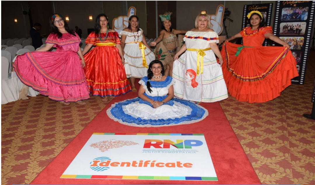
PARTICIPANTES DE LA PRESENTACION MUSICAL DE IDENTIDAD NACIONAL GRADUACIÓN DE LA I FASE CAPACITANDO CAPACITADORES HOTEL PLAZA DEL GENERAL, 06 de noviembre 2019