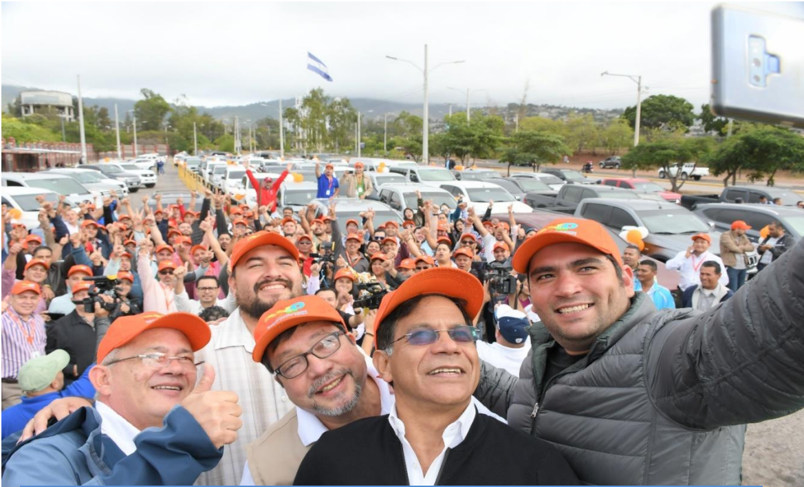
GRAN CARAVANA IDENTÍFICATE, ENTREGA DE LA FLOTA DE VEHICULOS A COORDINADORES Y SUPERVISORES DE ENROLAMINETO DEL PROYECTO Paseo del CNO a la UNAH, 23 de marzo 2020