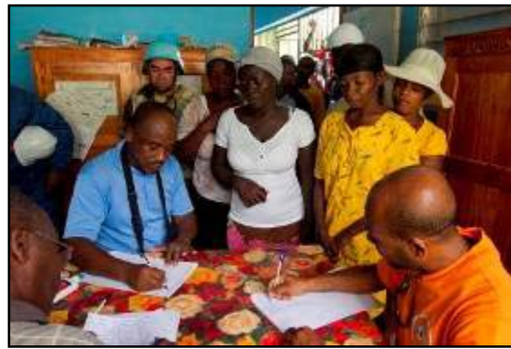
Exercice d'évacuation de 50 personnes de la commune de Cabaret, 09 juillet 2012, ©Victoria Hazou UN/MINUSTAH

A l'issue de cet exercice, le SNGRD a conduit des réunions d'évaluation conjointes afin de mettre en évidence les points nécessitant un travail de la part de tous les acteurs au niveau national (COUN/Emergency Joint Operations Center-EJOINT/Expanded Joint Operations Center-EJOC), départemental et communal. Un plan de suivi des leçons apprises et des actions futures a été mis en œuvre dans les semaines qui ont suivies l'exercice.