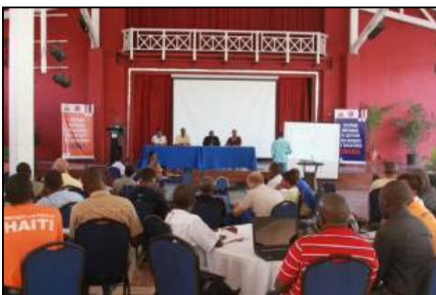
Atelier des leçons apprises, © Sophie Green/PNUD

Le SNGRD et la DPC ont été fortifiés en termes de coordination des activités de préparation et réponse grâce notamment à la tenue de réunions ou d'ateliers de travail réguliers permettant de réunir les principaux acteurs du système et leurs partenaires nationaux et internationaux. Ceci a doté le système d'une méthodologie et de réflexes majeurs tant au niveau national que départemental dans des domaines clés comme ceux de la saison cyclonique tels que l'élaboration de leçons apprises, la réalisation d'exercice de simulation et le développement ou la mise à jour des plans de contingence. Cette systématisation en termes de coordination – du côté national et international – a renforcé les partenariats et rendu plus effectif la coordination entre les différents niveaux et acteurs.