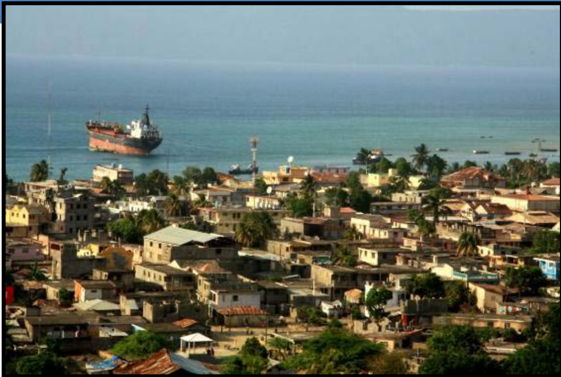
Port-de-Paix, Haïti, © Sophie Green/PNUD