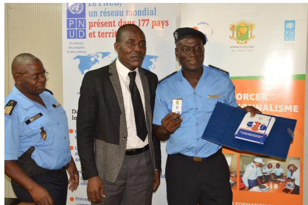
Remise de kits aux participants