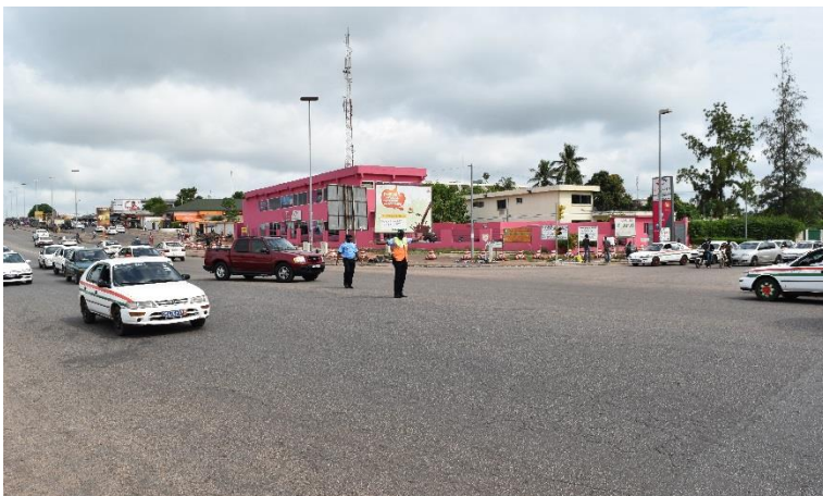
Yamoussoukro : Formation en sécurité routière sur l'axe principal

L'action visait à élaborer un plan pour chaque unité déconcentrée de formation, en tenant compte des thématiques à administrer en fonction des réalités contextuelle. Ce sont au total, 8 propositions de plans bisannuels régionaux (comprenant les nouvelles thématiques identifiées) qui devaient être