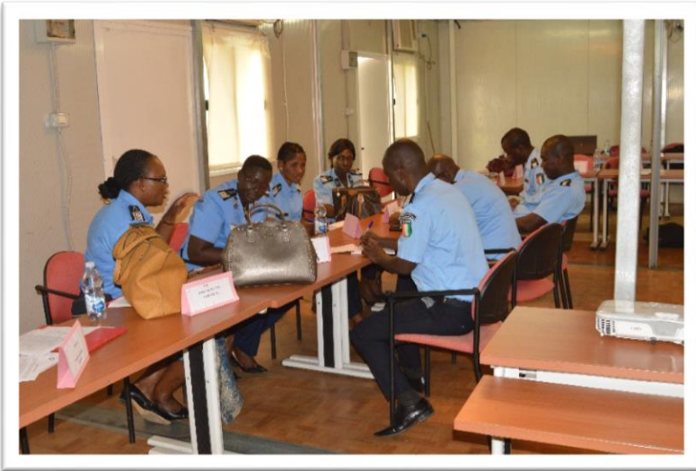
Groupe de Coordonnateurs en atelier

appuyer l'initiative de formation continue déconcentrée au niveau local, la formation de 100 coordonnateurs régionaux et centraux a été planifiée. Cet objectif chiffré, a été revu à la baisse lors de la séance de cadrage avec les experts qui ont estimé que l'effectif de 20 coordonnateurs par session devait être retenu afin d'atteindre de meilleurs résultats dans le cadre de l'andragogie. Aux termes des 4 sessions de formation, ce sont en définitive 86 coordonnateurs régionaux et centraux qui ont été formés sur les 80 attendus. Ces formateurs issus du niveau 1, 2, 3 et 4 de l'effectif des formateurs dont dispose la